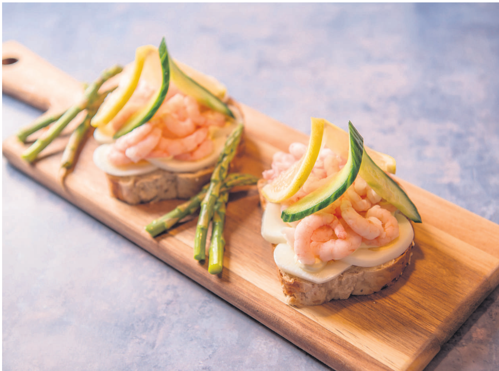
En skøn rejemad er punkt nr. 7 på dagsordenen om jeres fælles økonomi.